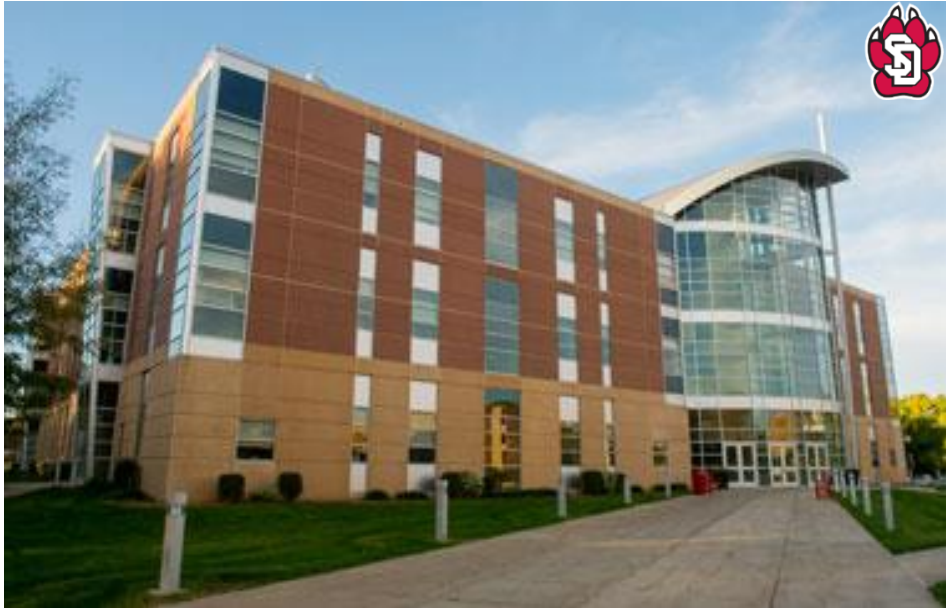
South Dakota Biomedical Infrastructure Network Division of Basic Biomedical Sciences Sanford School of Medicine University of South Dakota, Vermillion, SD 57069 USA